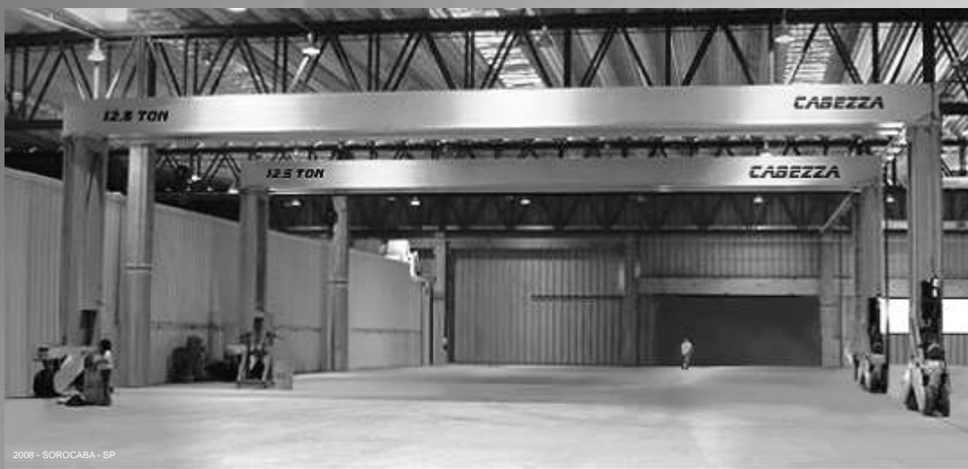
2008 - SOROCABA - SP