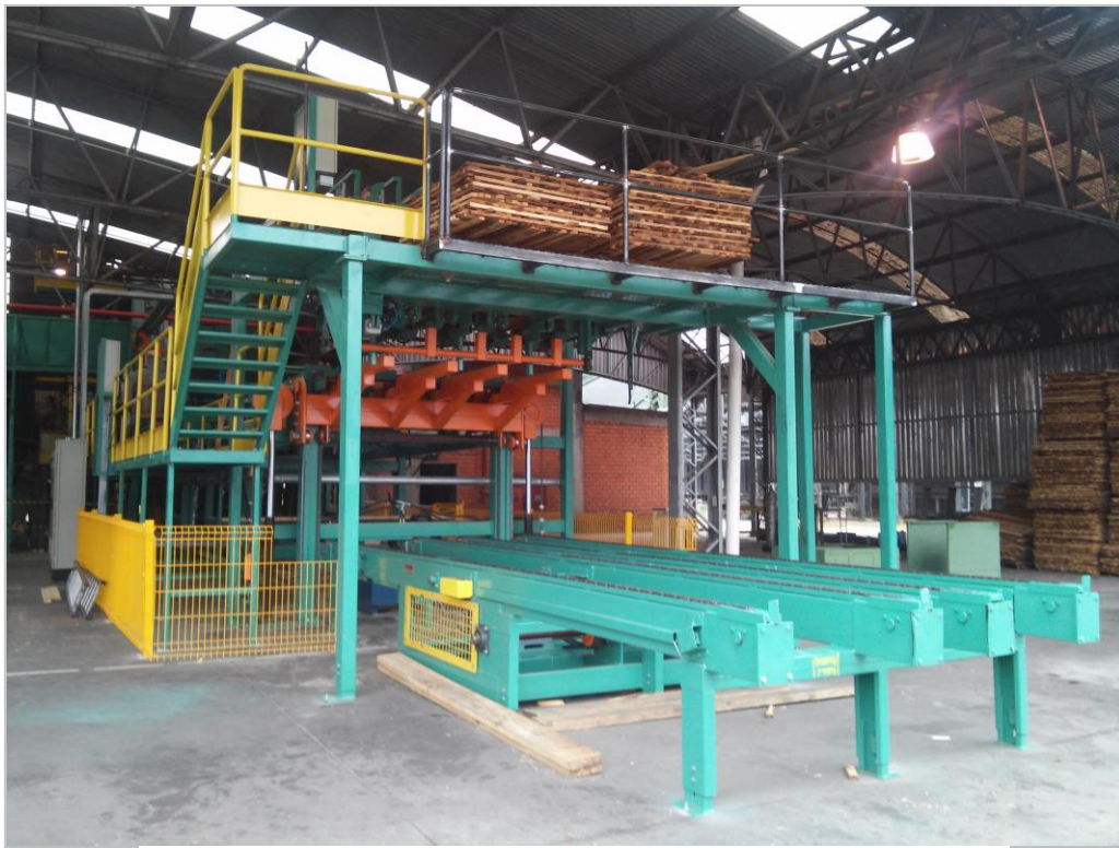
Figura 4 - Gradeador Automático Tábuas