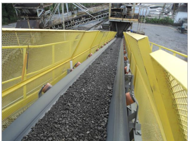
Figura 1 - Transportador Correia 30''