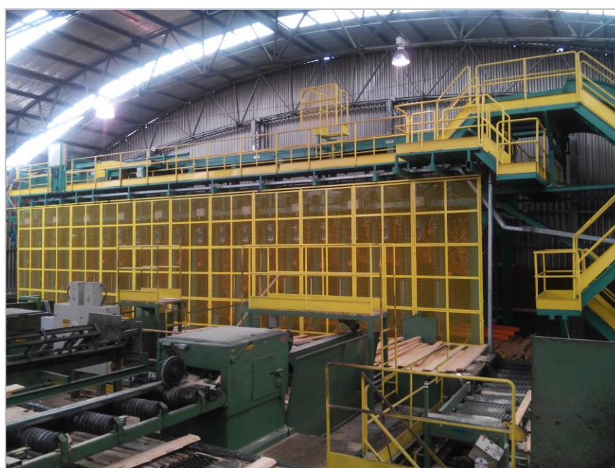
Figura 3 - Linha Classificação Tábuas