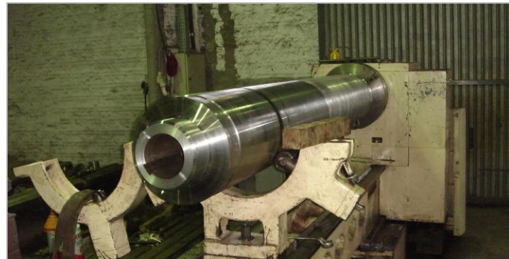
Figura 6 - Usinagem