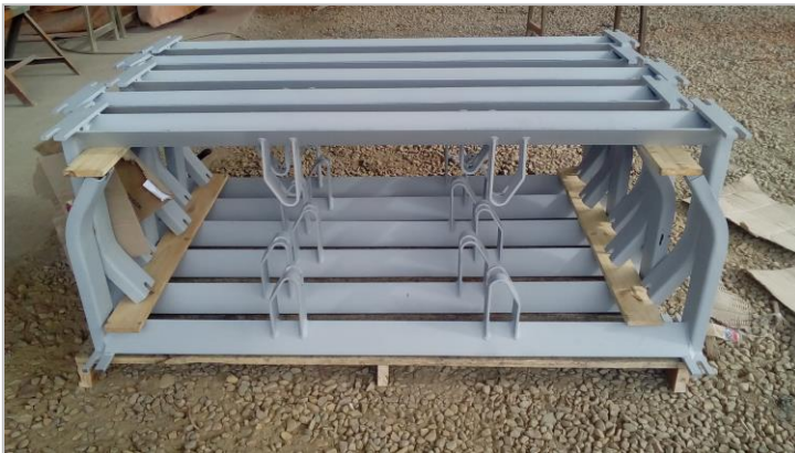
Figura 5 - Calderaria